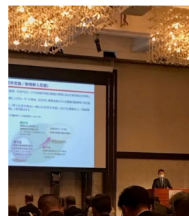
地元でのマッチングイベント開催の様子